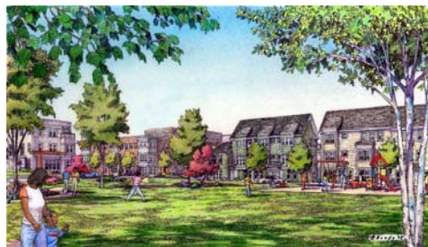
Versión artística del futuro Parque en Washington Beech

Todas las familias viviendo en Fase Uno de Washington Beech ya han sido trasladadas. Casi la mitad de esos residentes se han mudado para otras comunidades de BHA, y la otra mitad aceptaron los cupones de Sección 8 y se mudaron para casas privadas. Gracias a todas las familias y a nuestro personal de reubicación por una transición tranquila y efectiva.